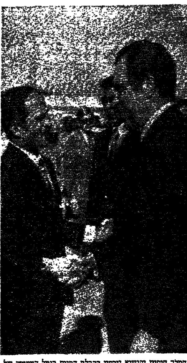
המלך חוסיין הגדול בביקורו בירושלים...